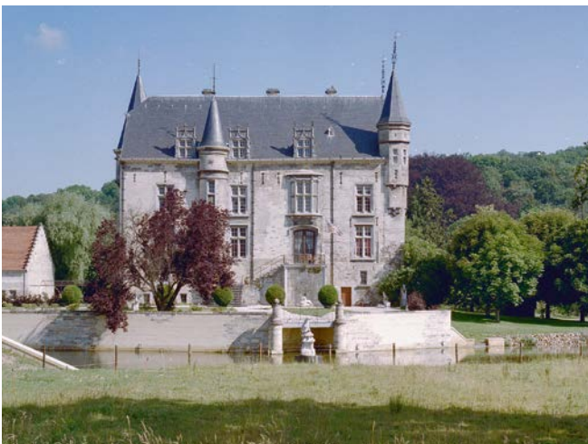
Het zestiende-eeuwse Kasteel Schaloen in Schin op Geul. L.M. Tangel 2004

De ideeën om arkels aan te brengen deden Nederlanders op bij de vestingen en kastelen in het Midden-Oosten. Hoewel de arkels doorgaans klein waren, boden ze schildwachten de nodige bescherming én goed zicht op de omgeving. De negentiende-eeuwse Franse architect en auteur Viollet-le-Duc schrijft in zijn Dictionnaire raisonné de l'architecture française du XIe au XVe siècle (1854–1868) dat de eerste arkeltorentjes mogelijk van hout waren. In tijden van oorlog werden ze op houten balken aan de muren bevestigd. Ze stonden vanaf de elfde eeuw bekend als hordijzen. Al in de twaalfde eeuw volgde een verbeterde uitvoering in steen op kraagstenen: de mezekooi of mezekouw. Daarvan is helaas geen enkel Nederlands voorbeeld overgebleven. Maar de kopergravure van Merian uit 1647 van de middeleeuwse stadsmuur van Aken geeft een goed beeld van de verschillende mezekouwen. In de loop der eeuwen ontwikkelden de arkels zich via de stadskastelen tot de nu bekende hangerkers. In de laatste fase van hun ontwikkeling belandden ze op de begane grond. Opvallend is het toenemend gebruik van glas, soms zelfs glas-in-lood, en licht.